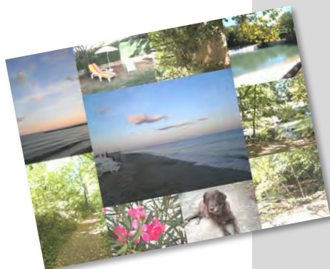
PHOTO OU PÊLE-MÊLE PHOTOS

1 à 10 photos papier 200g couché brillant